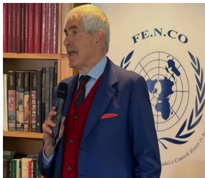
Sen. Pier Ferdinando Casini