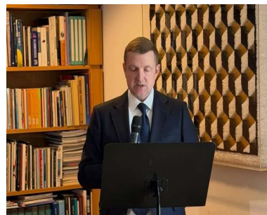
Amb. Ucraina Ihor Brusylo