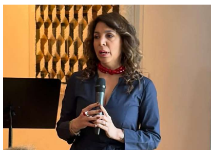
Amb.Colombia Ligia Margarita Quessep Bitar