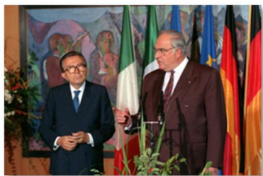
Giulio Andreotti ed Helmut Kohl: la riunificazione della Germania, lezioni per oggi

Convegno Internazionale – Urbino 28/29 ottobre 2021