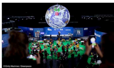
Cop26 NOT IN SALE Green Peace

Ogni giorno i media ci ricordano che il nostro futuro e quello dei nostri figli sarà condizionato da momenti difficili.