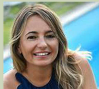
Console Generale Onorario del Bangladesh a Firenze Distretto Consolare: Toscana, Umbria e Marche

„IMPEGNO, PASSIONE, SOLIDARIETA' E SENSIBILITA'“