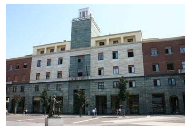
Palazzo della Camera di Commercio